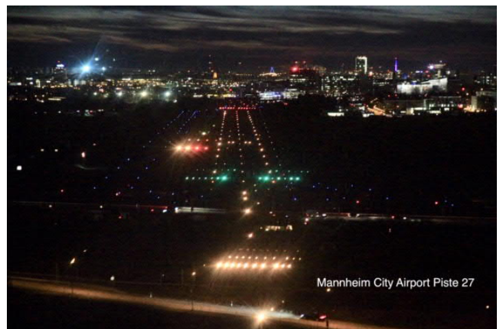
Mannheim City Airport Piste 27

Der City Airport in Mannheim mit Blick auf die Piste 27