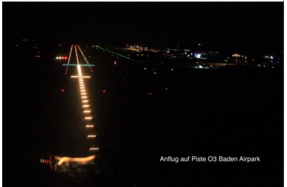
Anflug auf Piste 03 Baden Airpark

Anflug auf die Piste 03 vom Baden Airport