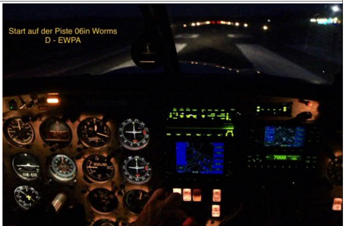
Start auf der Piste 06 in Worms D - EWPA

Alles im Blick im Cockpit unserer Piper D-EWPA Beim Start auf der Piste 06 auf dem Wormser Flugplatz